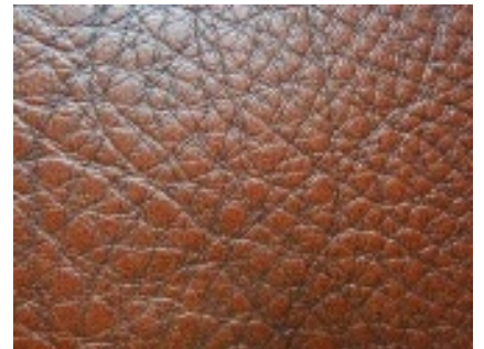
structuurverschillen in een lederhuid